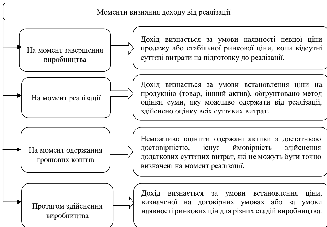
Рис. 1. Моменти визнання доходу від реалізації

Відповідно до П(С)БО 15 «Дохід» існують два методи визнання доходу від надання послуг [2]: виходячи із ступеня завершеності операції з надання послуг на дату балансу; шляхом рівномірного його нарахування за певний період часу.