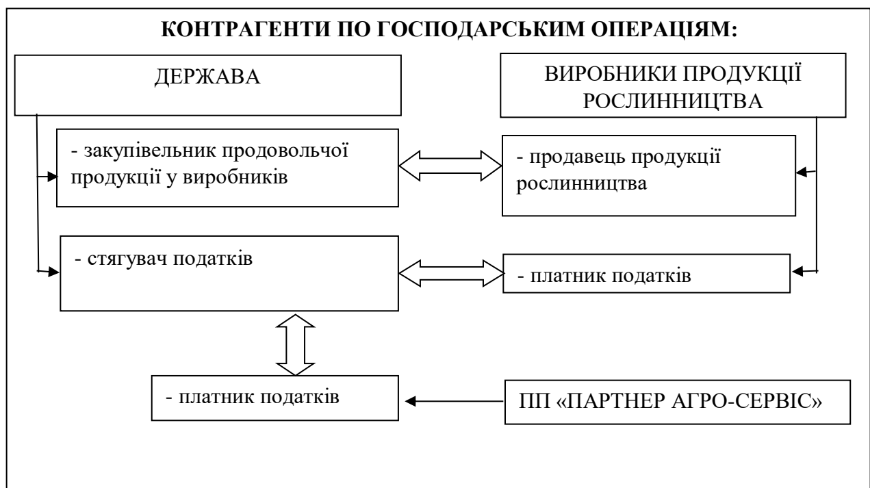
Рис. 1 – Протилежність економічних прагнень між учасниками ринкових відносин аграрної сфери

У системі продовольчої безпеки ПП «Партнер Агро-Сервіс» нами було віднесено до обслуговуючої ланки, безпосередньо наближеної до виробництва. Взаємодія між учасниками в аграрній сфері має різнонаправлену векторність, бо з однієї сторони, вони виступають як контрагентами на ринку та примусовим виплатам податку, а з іншої - отримують взаємну користь від цих відносин, тобто вони мають соціальний ефект (рис. 1).